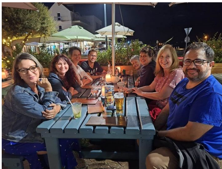
Figuur 1. Bestuursvergadering van die voormalige SAVN-bestuur in Hermanus in Januarie 2024.