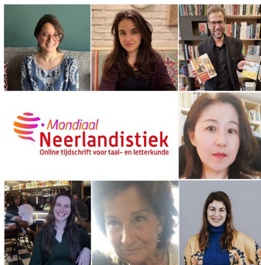
Figuur 6. Die redaksie van Mondiaal Neerlandistiek.a